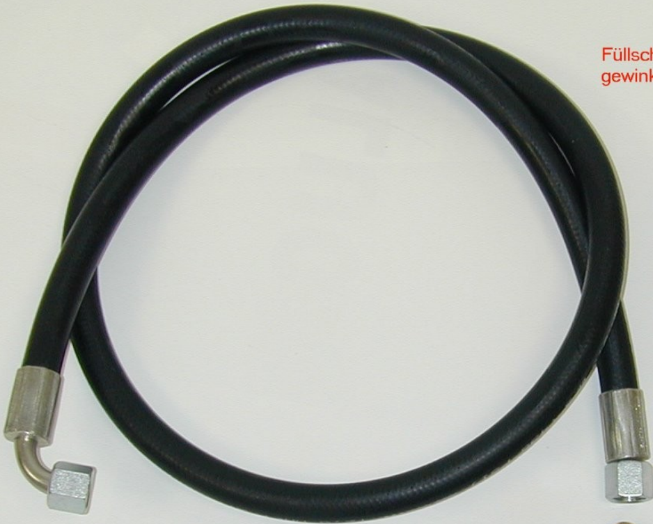
Füllschlauch gewinkelt, 1,5 m