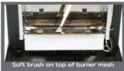
Soft brush on top of burner mesh