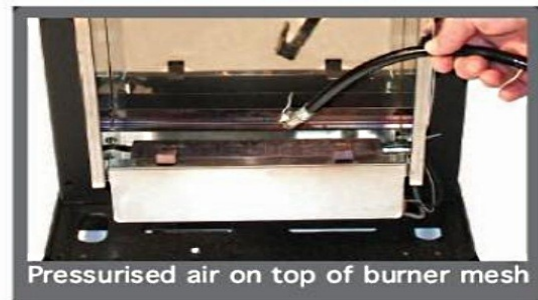
Pressurised air on top of burner mesh