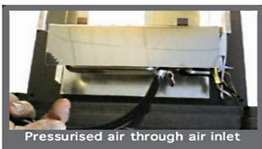
Pressurised air through air inlet