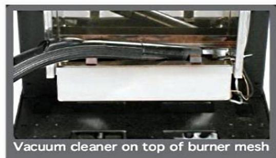
Vacuum cleaner on top of burner mesh