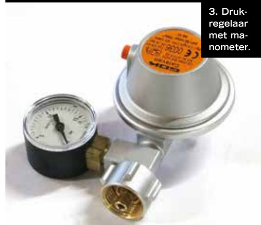
3. Drukregelaar met manometer.