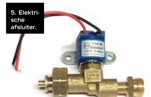
5. Elektrische afsluiter.

Bovendien moeten er altijd slangen worden gebruikt met aangepaste koppelingen. In de meeste watersportzaken zijn slangen met verschillende koppelingen en in verschillende lengtes te koop.