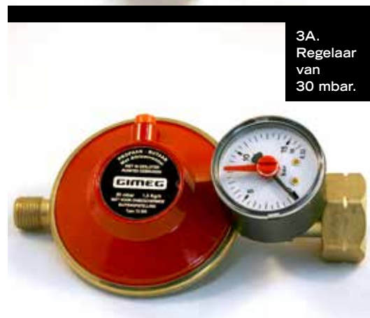
3A. Regelaar van 30 mbar.