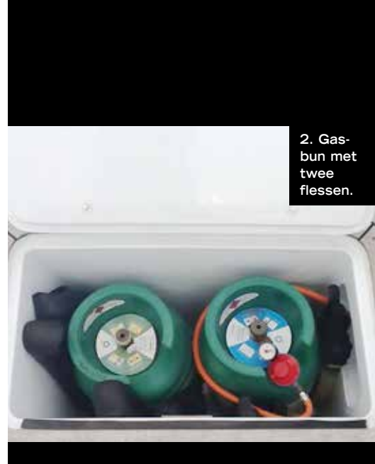
2. Gasbun met twee flessen.

In het buitenland zijn 'onze' gasflessen niet zonder meer om te ruilen. En dat zit hem in de aansluitnippels. Blauwe Campingazflessen kunnen in de