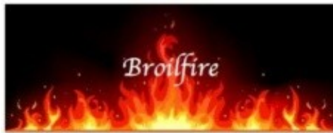
Broilfire Brassero Fire Grill