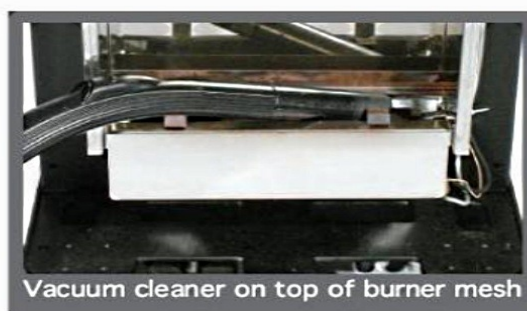
Vacuum cleaner on top of burner mesh