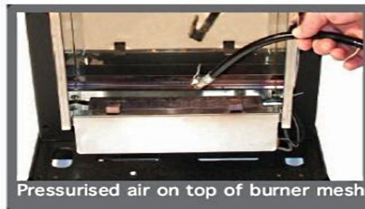
Pressurised air on top of burner mesh